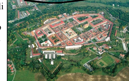
Pevnost Josefov 19.3.2011